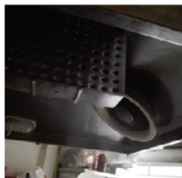
Foto 4. Campana con sistema de extracción