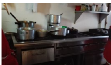
Foto 3. Estufa extracción