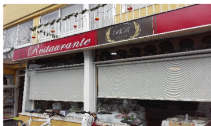
Foto 2. Fachada del predio