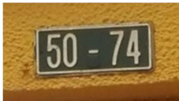
Foto 1. Placa del predio

ALCALDÍA MAYOR DE BOGOTÁ D.C. SECRETARÍA DE AMBIENTE